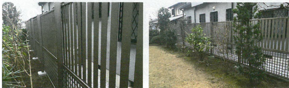
▲ももとは生け垣でしたが、手入れにとっても苦労が掛かっていました。枯れかけてしまっていた生け垣を撤去し、丈夫なアルミフェンスを設置しました。