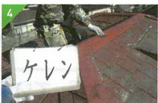
▲汚れやサビを落とします。