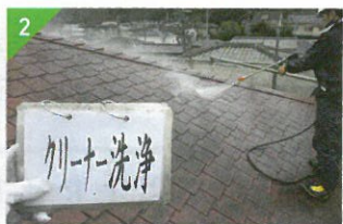
▲高圧洗浄で汚れ等を落とします。