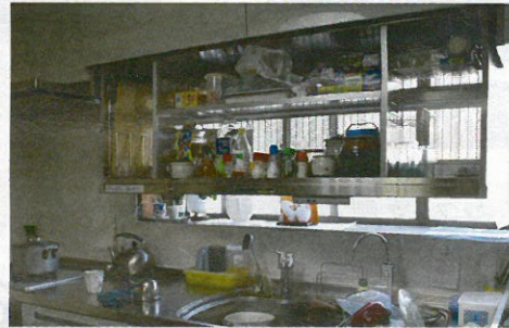
▲ボタンを押すと、電動で収納スペースが昇降します。使いやすい位置で止めての使用ができます。