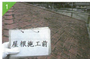
▲汚れやコケが付着しています。