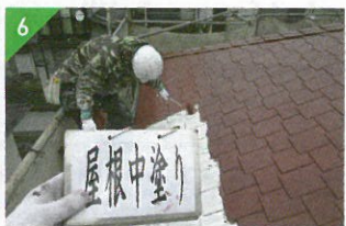
▲下塗りと上塗りの中間層。