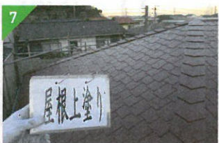
▲仕上げとして塗りムラをなくします。