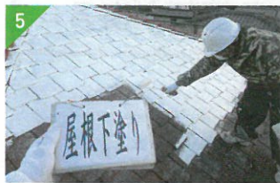
▲下塗りで塗料の密着を良くします。