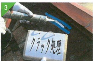
▲ひび割れなどは事前に補修します。